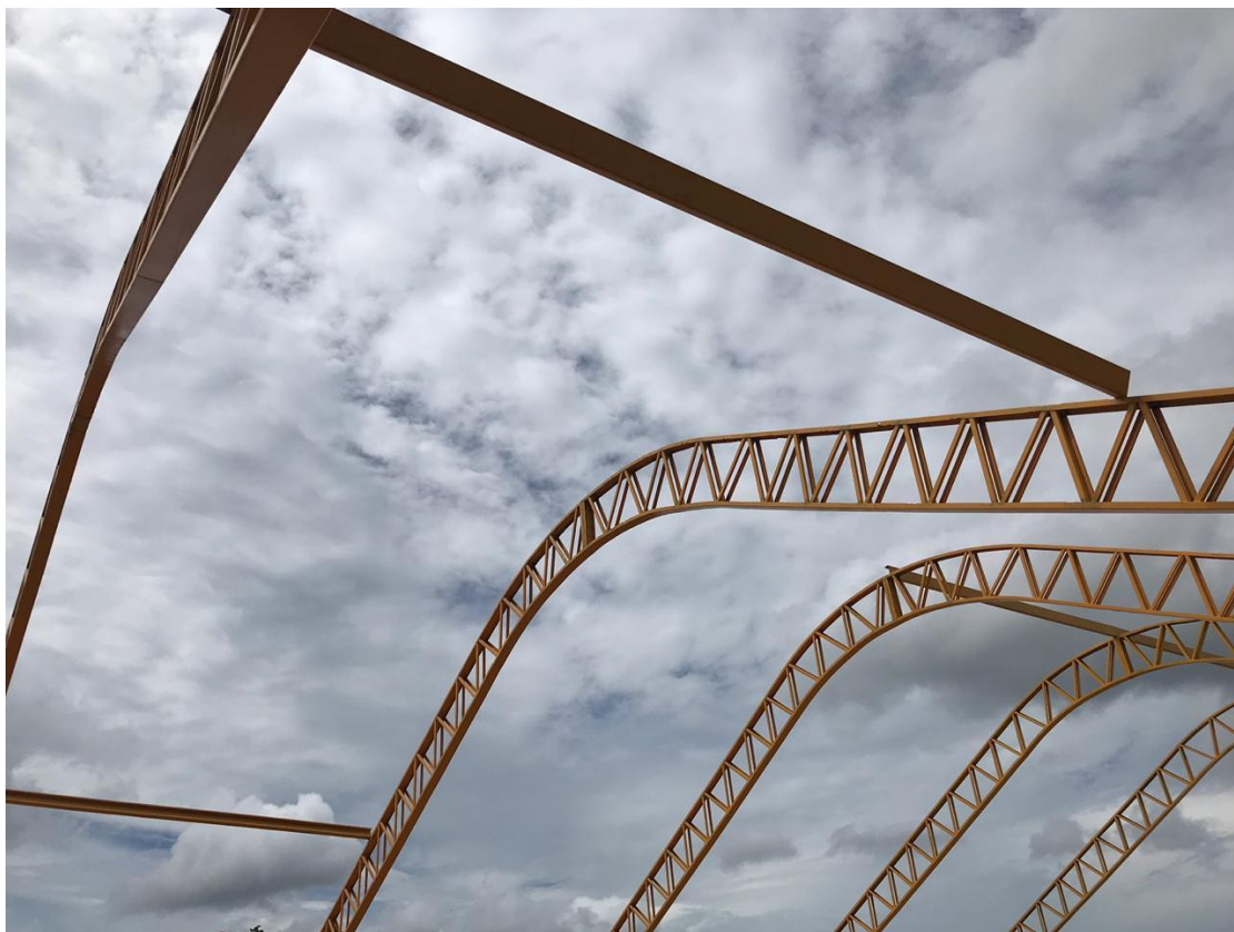
Foto 3: Estrutura metálica em arco vão para recebimento da cobertura.