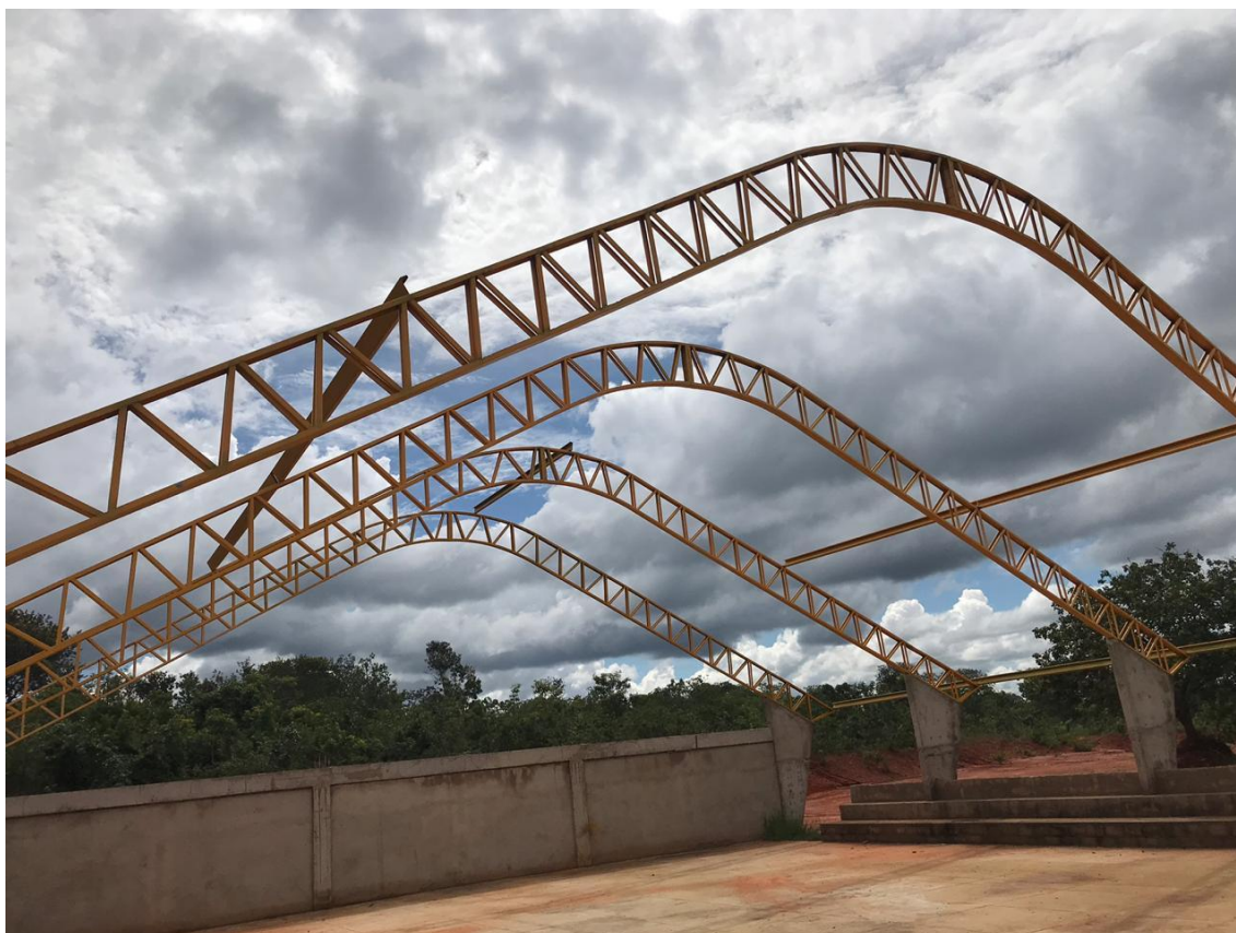
Foto 4: Estrutura metálica em arco vão para recebimento da cobertura.