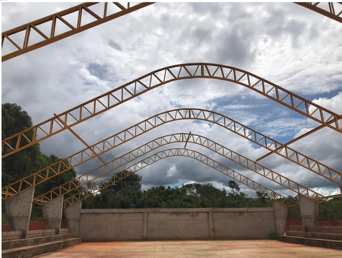
Foto 5: Estrutura metálica em arco vão para recebimento da cobertura.