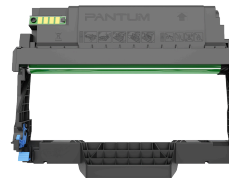
Unidade de Cilindro DL 5120 30000pages