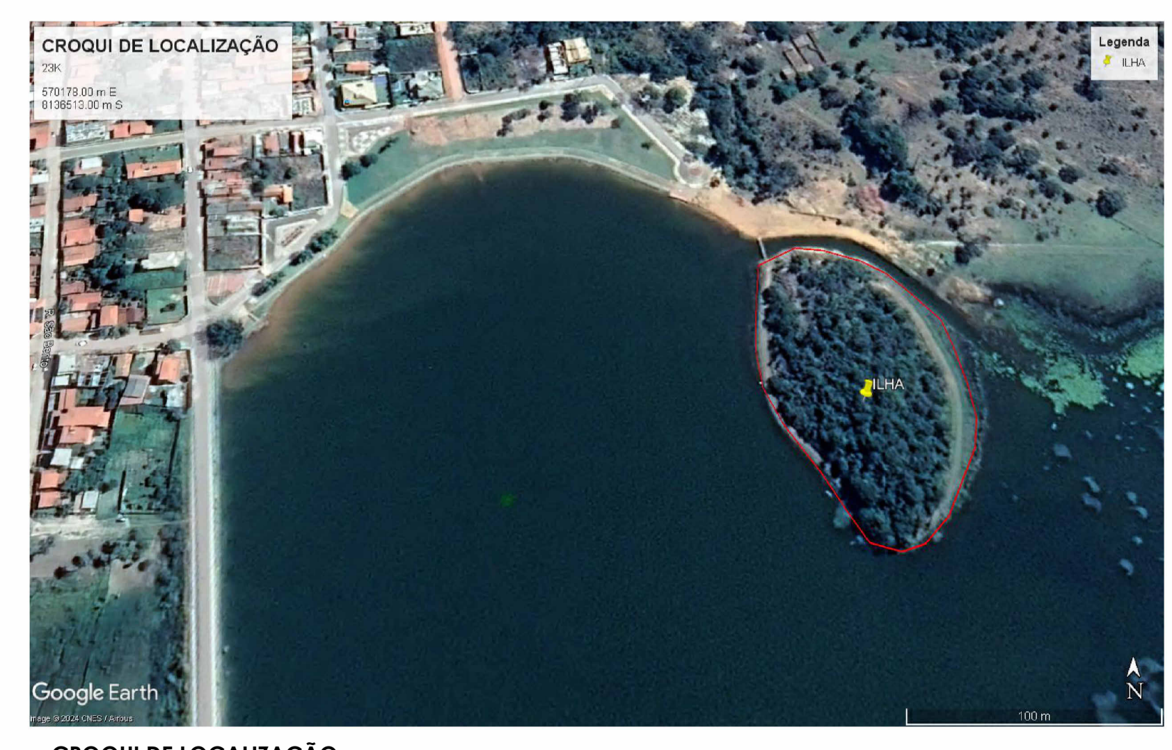
CROQUI DE LOCALIZAÇÃO ESC: 1 : 200