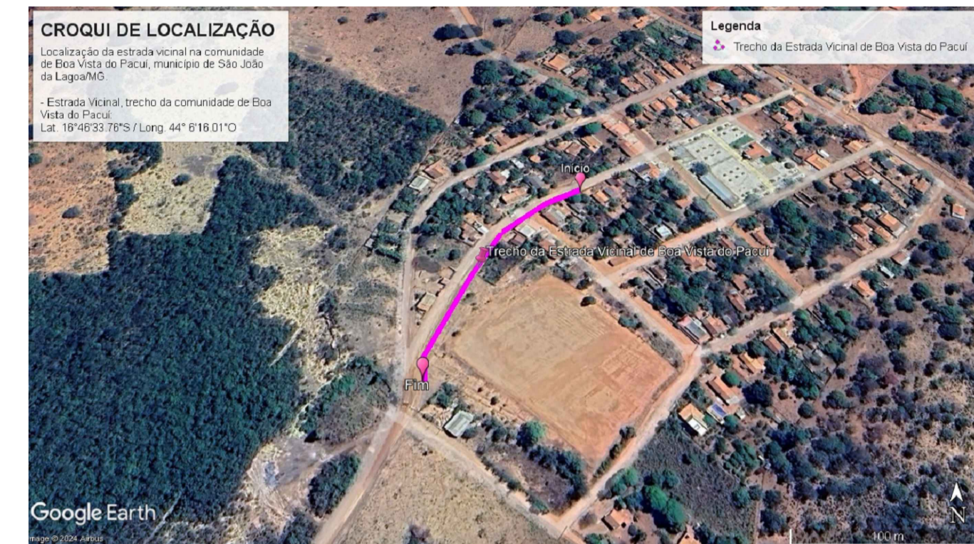
01 CROQUI DE LOCALIZAÇÃO SEM ESCALA